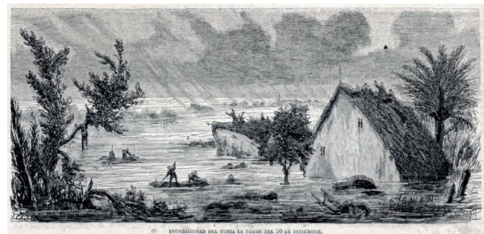
Vista d'Alzira. Vicent Boix, Memoria histórica de la inundación de la Ribera de Valencia en los días 4 y 5 de noviembre de 1864 , València, 1865.