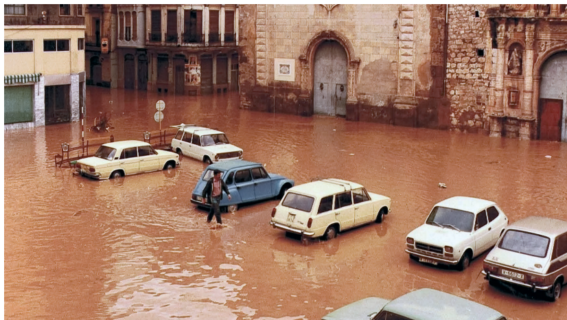
La plaça Major d'Algemesí, rere la pantanada del 1982.